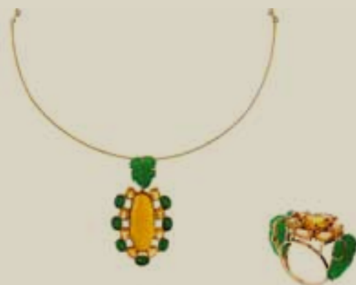
PINGENTE MAJESTOSA EM OURO 18K, JADES, CITRINOS E GEMA VEGETAL DE PAU AMARELO • ANEL MAJESTOSA, EM OURO 18K, JADES E CITRINOS DESIGN> HELENA BEZERRA | OURIVESARIA> JOSÉ CARDOSO LAPIDAÇÃO> LEILA SALAME | GEMA VEGETAL> PAULO TAVARES E MÔNICA MATOS