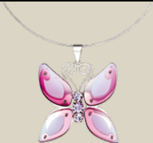
PINGENTE FADA ROSA, EM PRATA, LENTE CR39, AMETISTA ROSE D'FRANCE DESIGN> LÍDIA ABRAHIM | OURIVESARIA> EDNALDO PEREIRA