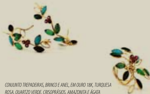
CONJUNTO TREPadeiras, BRINCO E ANEL, EM OURO 18K, TURQUESA ROSA, QUARTZO VERDE, CRISOPRÁSIOS, AMAZONITA E ÁGATA DESIGN> MARCILENE RODRIGUES | OURIVESARIA> SILA BRASILA | LAPIDAÇÃO> LEILA SALAME